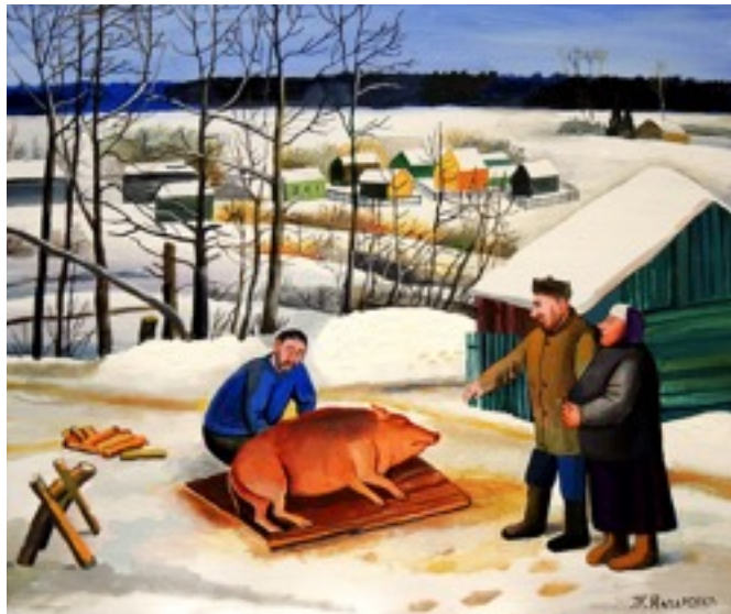
3. Lot 191 : Avant le Nouvel An, Tatyana Nazarenko. Vendu pour 3.177 €.

Cette peinture contemporaine est une huile sur toile datant de 2014. Elle est peinte par un membre renommé de l'Académie russe des Beaux-Arts Tatiana Nazarenko.