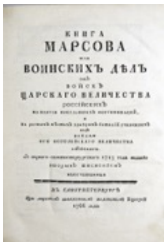
4. Lot 298 : Livre de Mars. Vendu 34.424 €.

Cette peinture contemporaine est une huile sur toile datant de 2014. Elle est peinte par un membre renommé de l'Académie russe des Beaux-Arts Tatiana Nazarenko.